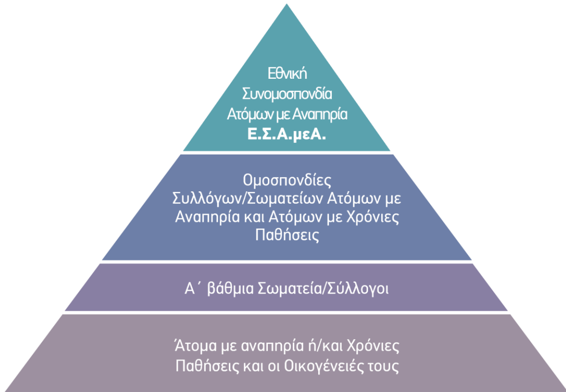
Εικόνα 1. Οργανωτική δομή εθνικού αναπηρικού κινήματος